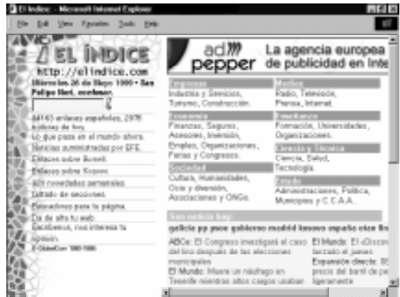
EL ÍNDICE elindice.com

Este motor de pesquisa cumpriu três anos de funcionamento no passado mês de Outubro. Desde o princípio o seu objectivo tem-se centrado na compilação de páginas web feitas em Espanha. Oferece links através de um índice temático e a possibilidade de usar palavras chave. Neste segundo caso, permite centrar a sua pesquisa em páginas web, ou nas notícias do dia ou da semana. O modo mais rápido é recorrer ao índice temático por ordem alfabética. Inclui links para os meios de comunicação que oferecem notícias sobre Internet, destacando as palavras ou personagens mais citados.