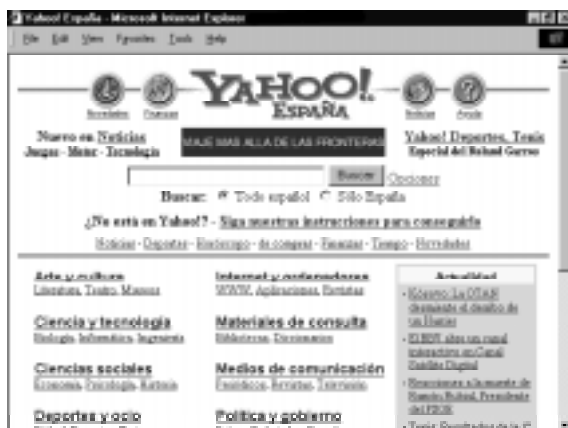
YAHOO! ESPAÑA www.yahoo.es