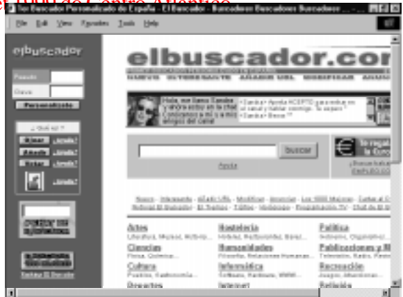
EL BUSCADOR www.elbuscador.com

Apresenta-se como o primeiro motor de pesquisa de Espanha. O cibernauta pode escolher links e preparar com eles uma versão própria da página. Isso complica um pouco o funcionamento. Tem ideias diferentes de outros sites do seu género, como a possibilidade de carregar a página de um link numa nova janela do browser sem se perder a referência ao índice. Organiza os seus recursos por temas e permite usar palavras chave para a pesquisa. O seu serviço de notícias (agência Efe) só permite ver um parágrafo. Tem outras funções interessantes (folhear, votar ou adicionar à personalização) sobre cada direcção indexada.